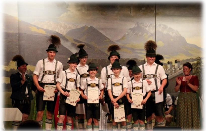
Im Hintergrund die Siegergruppe aus Schleching und vorne „die Sieger der Herzen“ Marquartstein I