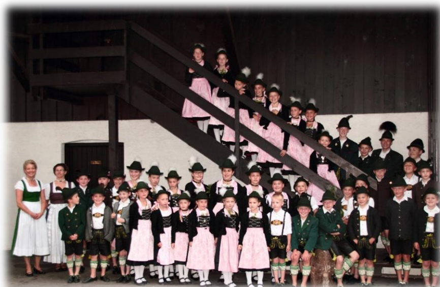
Die Kinder- und Jugendgruppe mit ihren drei Jugendleitern.